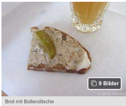
Brot mit Bollanditsche

Der Sonntag wurde mit einem speziellen Gottesdienst für die Hoheiten eingeläutet. Der Bollenlauf ist inzwischen auch schon Tradition, aber es ist ein Wettrennen, bei dem die Läufer keine Bollen balancieren müssen. Der Name kommt daher, dass er zum Bollenfest veranstaltet wird.