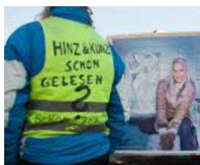
SIE kommt spät - aber sie KOMMT !!