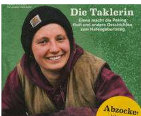
AB MITTWOCH auf dem Lohbrügger Markt !!