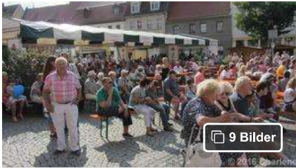
Der Marktplatz von Calbe ist gut besucht

Calbe (Saale): Calbe (Saale) | Die Stadt Calbe an der Saale hatte unsere Bergedorfer Königin der Texte zum 15. Bollenfest eingeladen.